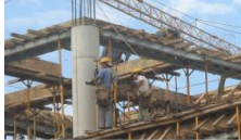
Construction industry/Industria de la construcción