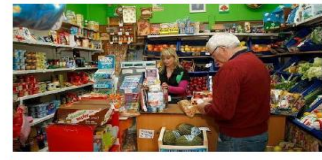
Retail/Venta al por menor

Workers look after our health./Los trabajadores cuidan nuestra salud.