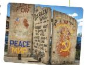
A sector from the Berlin Wall.

4 Between 1945 and 1990, the world was divided into two blocks with different political ideas: the communist block and the capitalist one. At the end of the 20 th century, the world was globalized until it was configured as we know it nowadays.