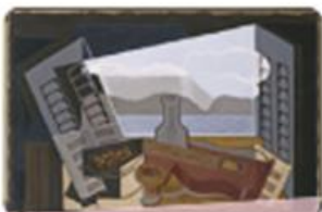
La ventana abierta de Juan Gris