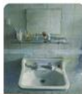
Sink and Mirror by Antonio Lopez