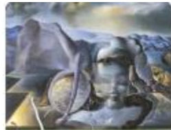
The Endless Enigma by Salvador Dali