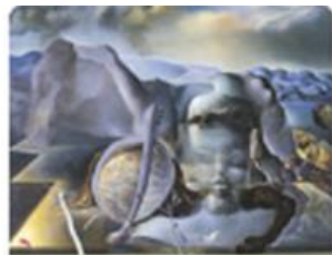
El enigma sin fin de Salvador Dalí