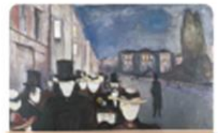
Tarde de primavera de Edvard Munch