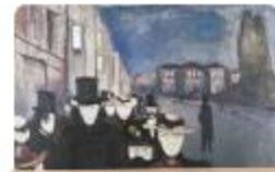
Spring Evening by Edvard Munch