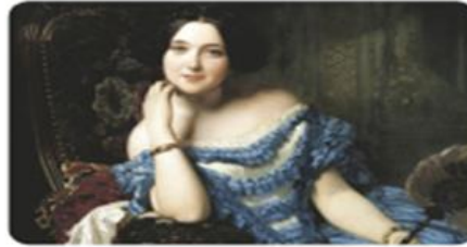
Amalia de Llano, Countess of Vilches. Madrazo and Kuntz, 1853.

Los nobles tenían privilegios y se enriquecieron porque poseían la mayor parte de las tierras. A finales de siglo, los industriales y comerciantes lograron ser más ricos que los nobles.