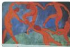
Dance by Henri Matisse