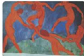
Danza de Henri Matisse