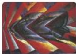
Dynamism of a Car by Luigi Russolo