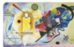
Yellow, Red and Blue by Wassily Kandinsky