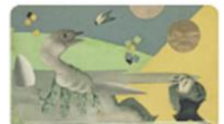
Amenaza en el prado verde de Hannah Höch