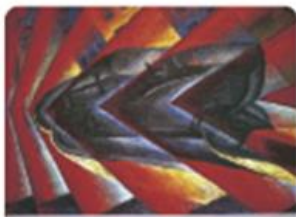
Dinamismo de un automóvil de Luigi Russolo