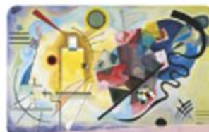
Amarillo, rojo y azul de Wassily Kandinsky