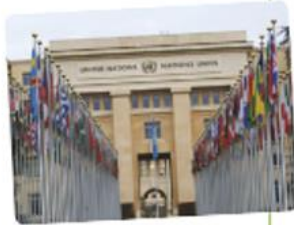
El Palacio de las Naciones Unidas en Ginebra, Suiza.

3 Entre 1914 y 1945 se produjeron dos guerras: la Primera y la Segunda Guerra Mundial, con un periodo de tiempo entre ambas. Al finalizar la Segunda Guerra Mundial se creó la ONU para mantener la paz entre los países.