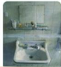
Lavabo y espejo de Antonio López