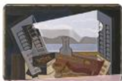
The Open Window by Juan Gris