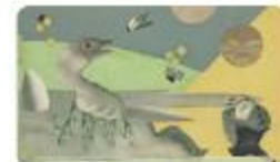
Threat on the green meadow by Hannah Höch