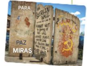
Un sector del Muro de Berlín.

4 Entre 1945 y 1990, el mundo se dividió en dos bloques con ideas políticas diferentes: el bloque comunista y el capitalista. A finales del siglo XX, el mundo se globalizó hasta configurarse como lo conocemos hoy en día.