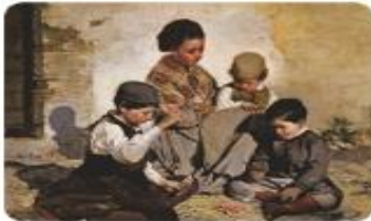
Chicos jugando a las cartas. Rafael Romero Barros, 1868.

The nobles had privileges and became wealthy because they owned most of the land. By the end of the century, industrialists and merchants managed to become richer than the nobles.