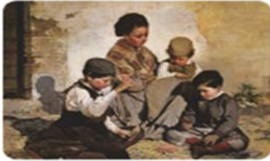
Chicos jugando a las cartas. Rafael Romero Barros, 1868.

Los nobles tenían privilegios y se enriquecieron porque poseían la mayor parte de las tierras. A finales de siglo, los industriales y comerciantes lograron ser más ricos que los nobles.