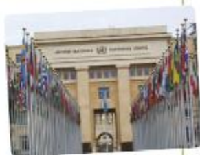
The United Nations Palace in Geneva, Switzerland.

3 Between 1914 and 1945, there were two wars: World War I and World War II , with a period of time between them. At the end of the Second World War, the UN was created to keep the peace between countries.